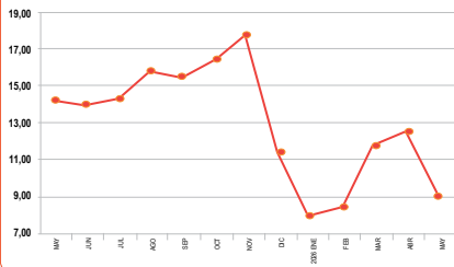
Santa Cruz: Evolución del Precio del Pollo Vivo pagado al Productor (en Bs./Kg.)